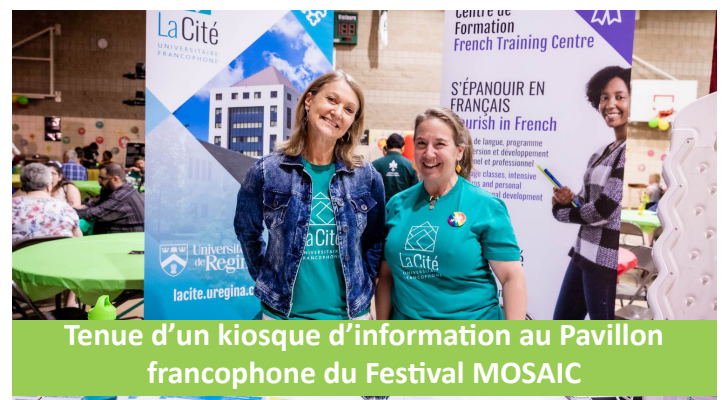
Tenue d'un kiosque d'information au Pavillon francophone du Festival MOSAIC