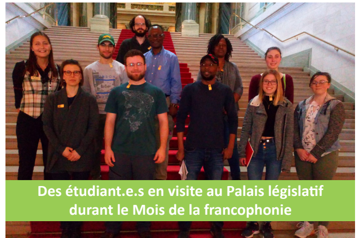
Des étudiant.e.s en visite au Palais législatif durant le Mois de la francophonie

➤ Discussion au sujet de la Boîte à outils du CNFS .