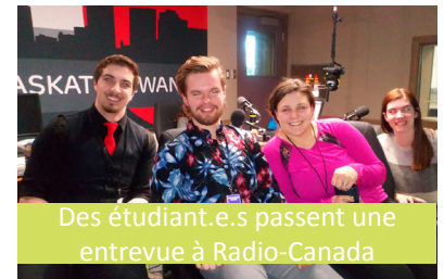
Des étudiant.e.s passent une entrevue à Radio-Canada

81 apparitions médiatiques de La Cité peuvent être dénombrées entre le 1er mai 2019 et la fin du mois de mars 2020 dans des médias variés : Ici Saskatchewan, L'Eau vive, CTV, La Liberté, Radio-Canada Manitoba, Le Nénuphar, CBC, Le Réveil (Radio-Canada Acadie) et l'APF.